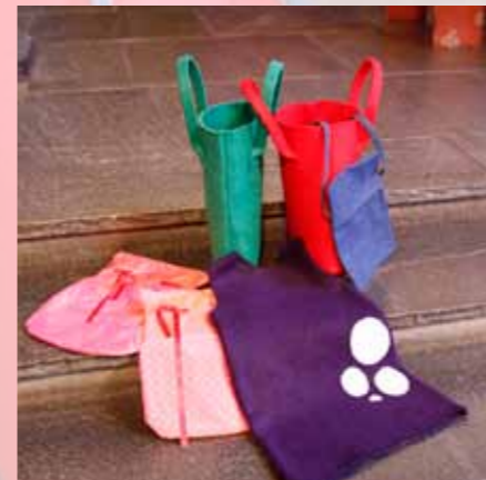
Hemslöjd från syateljén i Tøyenkirken.