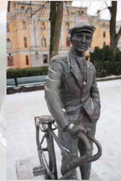
Bildtext: Gunnar Sønsteby minnesstaty står på Karl Johan i Oslo.