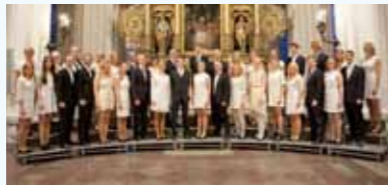
Kirkemusikkfestivalen 7-15 mars Läs mer på sidan 14.